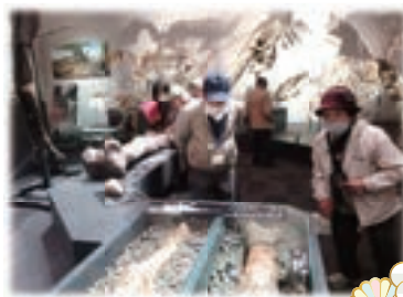
1日研修会 徳島博物館見学

できることひとつひとつを考え、まずは私からの気持ちを大事にして進んでいこうと思います。今後も会員の皆様、上勝町の皆様と力を合わせて進んでいきたいと思っています。